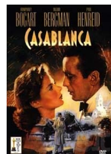
Casablanca Michael Curtiz Stati Uniti, 1943