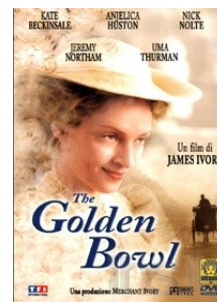
The golden bowl James Ivory Gran Bretagna, 2000