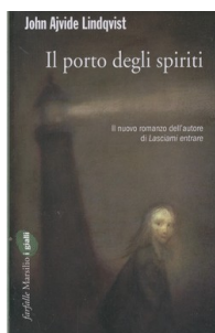
Il porto degli spiriti Lindqvist John A. Marsilio