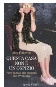
Questa casa non è un ospizio Federico Meg Sperling & Kupfer