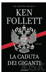
La caduta dei giganti Follett Ken Mondadori