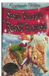
Sesto viaggio nel regno della fantasia Stilton Geronimo Piemme