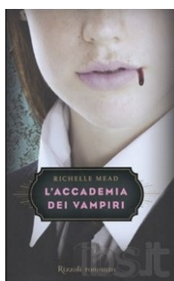
L'accademia dei vampiri Mead Richelle Rizzoli