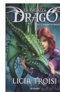
L'albero di Idhunn Troisi Licia Mondadori