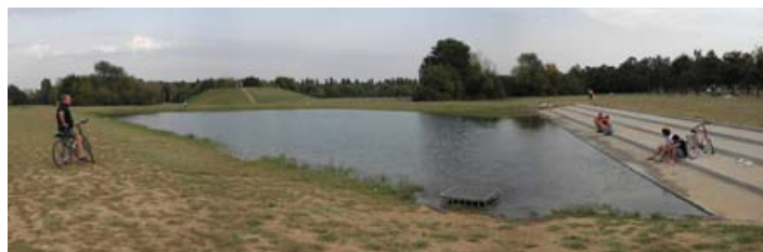
Autunno 2011: Prove di riempimento del primo lago nel Parco Nord Milano che sarà alimentato con le acque del Villoresi

Al fine di completare il percorso tra Nova Milanese e Cinisello Balsamo, in base agli accordi con il Parco Grugnotorto e i comuni interessati, stanno proseguendo anche le progettazioni relative alla realizzazione di una passerella ciclo-pedonale sul canale Villoresi di collegamento alla pista ciclabile e per la realizzazione di uno scarico ad acqua fluente per il lago di Sant'Eusebio di Cinisello al fine di migliorarne la qualità paesaggistica. Per primavera saranno terminati tutti i lavori di canalizzazione e, grazie all'impegno comune ET Villoresi- Parco Nord , nuovi corsi d'acqua e laghetti abbelliranno questa importante area verde ai confini di Milano.