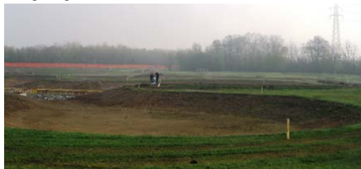
Un'ansa del nuovo lago sul derivatore Passirana, in corso di ultimazione

Allo stesso modo stanno per essere completati i lavori per la ricostruzione di un fontanile nel Parco della Balossa tra Cormano e Nova Milanese. L'intervento prevede la riqualificazione di un canale terziario del Villoresi che si dirama dal "Valle Seveso" in località Pilastrello per portare nuove acque ad un fontanile abbandonato che si trova appunto al centro del Parco della Balossa. I finanziamenti sono anche in questo caso della Direzione Paesaggio regionale nell'ambito della costruzione della Rete ecologica regionale.