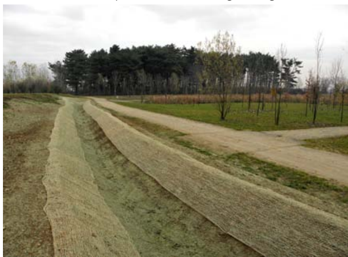
Il nuovo canale, quasi terminato, arriva al Lago di S. Eusebio a Cinisello Balsamo

Prima di Natale, in perfetto allineamento con la tempistica di progetto, saranno ultimati i lavori relativi alla sistemazione idraulica e alla riqualificazione ambientale del Canale diramatore 3/1 di Nova. L'intervento, svolto in collaborazione con il Parco del Grugnotorto-Villoresi è stato finanziato da Regione Lombardia tramite le direzioni Agricoltura, Territorio e Paesaggio. I lavori hanno portato alla riqualificazione ambientale di circa 20.000 mq attraverso la creazione di macchie boscate, filari alberati e prati rustici e la riqualificazione idraulica di un tratto di canale di oltre 1.800 m. L'inaugurazione delle opere avverrà a primavera quando saranno immesse le acque, con l'inizio della stagione irrigua.