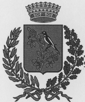
Comune di Gaggiano