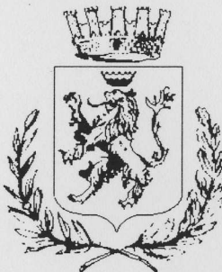
Comune di Abbiategrasso